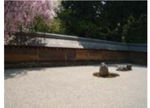
Thạch viên chùa Long An

Chưa kiếm được chỗ ngồi, tôi đứng im và, ô kìa thạch viên, tuy bị dây lưng và đầu người cắt vụn, vẫn không mất đi sức mời gọi. Tôi thì thầm: “Thạch viên ơi, hãy chờ! Còn một chút nữa thôi là trùng phùng!”. Khi đến được chỗ hàng đầu và ngồi xuống, tôi không còn biết là mình đang ở đâu, trước mắt chỉ duy nhất thạch viên, đầu óc trống hoác. Bài dịch thơ nào về thạch viên cũng chấp cánh bay xa.