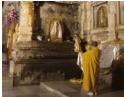
Bồ-đề Đạo Tràng

Chúng tôi đến sớm, chờ hơn nửa giờ, đúng 4 giờ sáng cổng mới mở cho vào khu vực chùa. Lễ Phật xong, mỗi người tự kiếm chỗ ngồi thiền. Đèn thấp sáng choang. Nghe rõ giọng tụng kinh, nhiều nhất bằng tiếng Pali, có khi bằng tiếng Hoa, chen lẫn vài tiếng cười khúc khích. Chung quanh người người chen chúc đi lại tấp nập. Thời gian ngồi thiền có lẽ khoảng hơn tiếng rưỡi đồng hồ, nhưng sao thấy quá nhanh. Điều ngạc nhiên là suốt ba buổi tọa thiền chúng tôi đều rất tĩnh lặng. Một sự tĩnh lặng thật trong thật lành như thể đang ngồi trong thiền đường hay giữa thời