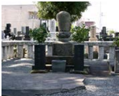
Bia mộ Bạch Ẩn

Giờ đây chung quanh chùa là phố xá dân cư sầm uất, nhưng tinh thần Pháp hội mùa xuân cách đây gần ba trăm năm có tồn tại chăng? Với minh sư và chánh