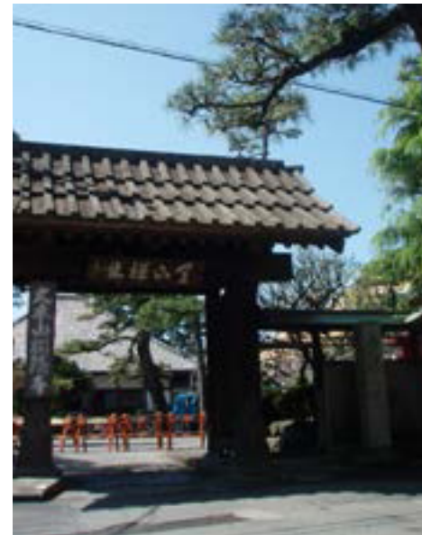
Cổng chùa Tòng Âm

Ít lâu sau Huệ Hạc bắt đầu dùng Pháp hiệu Bạch Ẩn (Hakuin). Điều này ngụ ý từ nay về sau Sư không rời xa chùa Tòng Âm, bởi vì Pháp hiệu của Sư dẫn xuất từ tên chùa đầy đủ là Hạc Lâm Sơn Tòng Âm tự (Kakurin-zan Shòin-ji), tức là chùa dưới bóng cây tùng trên núi Hạc Lâm. Khi