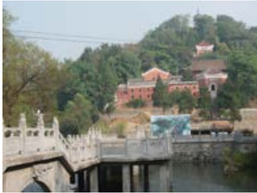
Chùa Tam Tổ

- Tam Tổ tự (xưa là Sơn Cốc tự) của tổ Tăng Xán trên núi Thiên Trụ, tỉnh An Huy, thành phố An Khánh, huyện Tiềm Sơn.