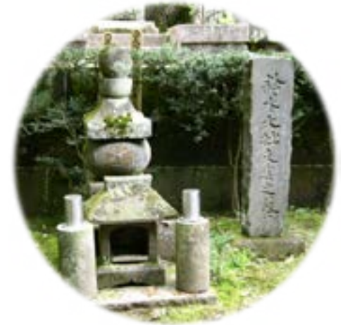
Bia mộ DT Suzuki (Linh Mộc Đế Thái Lan chi mộ)

Rừng tùng Viên Giác đã từng in dấu bước chân của Thầy, xa lâu nữa hạnh vô úy của tổ Vô Học Tổ Nguyên trước lưỡi kiếm của quân Mông Cổ, thêm một lần là đuốc sáng soi đường cho chúng tôi đi. Phải đợi đến Tùng Âm tôi mới có