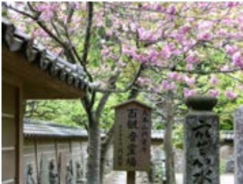
Nội viện chùa Viên Giác

Ngày cuối ở Nhật cũng là ngày chiêm bái trọng điểm: chùa Tùng Âm của Bạch Ẩn và chùa Long Trạch của đệ tử Ngài là Đông Lãn Viên Từ.