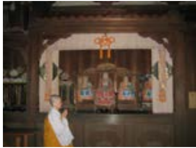
Nhà Tổ chùa Đại Đức

Tuy chân dung một vị thiền sư có vẻ “dữ dội,” khi “xô cờ ra trận” để tiếp đệ tử hay thiền khách trình kiến giải, nhưng đời tu vẫn không thiếu nét thơ mộng tự tại, như trên bước đường hành khước Đại Đẳng đã cảm thức: