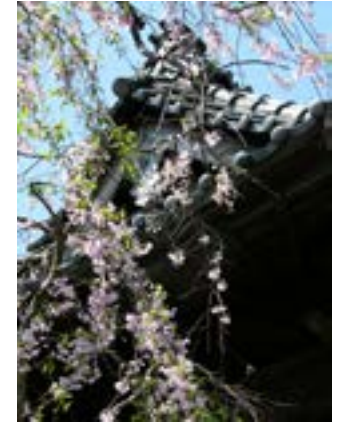
Hoa đào trên mái chùa Tùng Âm

Chùa Tùng Âm lâm vào tình trạng gần như đổ nát. Nhìn lên mái nhà sao trời lấp lánh thâu đêm. Sàn chùa luôn ẩm ướt vì mưa và sương. Thầy phải khoác áo toi khi đi trong chùa, làm lễ nơi chánh điện phải mang ủng. Tài sản của chùa đều rơi vào tay chủ nợ, đồ đạc đều bị cầm cố. Vật duy nhất đáng giá ở đây là ánh trăng và tiếng gió...”.