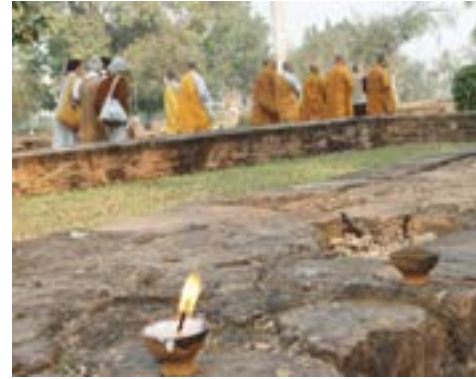
Vườn Cáp Cô Độc

kỳ nhập thất. Tĩnh lặng giữa ồn náo. Ngồi trên xe buýt rời Bồ-đề Đạo Tràng, tôi nghiệm ra rằng có một điều gì kỳ diệu trong cảnh ồn náo mà mọi nơi khác khó có được. Đó là niềm tin. Niềm tin từ những gương mặt thành kính, cao độ và mãnh liệt, đã lan tỏa cùng khắp. Có thể nói tôi như bị nuốt chửng trong khối tín ngưỡng này. Được giúp sức từ tha lực của chư Phật và của tín đồ đang hành đạo tại đây, trong tôi phát triển một sự an tĩnh sâu và đầy, thật bền vững. Bền vững