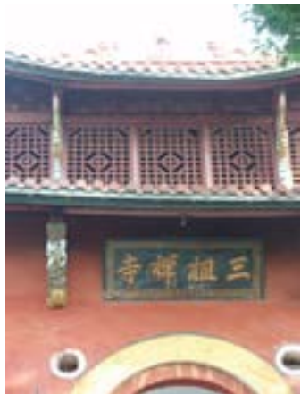
Tam Tổ thiên tự