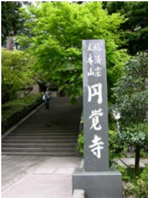
Bảng tên chùa Viên Giác

tôi đến Kamakura, viếng chùa Viên Giác do tổ Lan Khê Đạo Long và chùa Kiến Trường do tổ Vô Học Tổ Nguyên đều từ Trung Hoa đến khai sơn. Ở Kiến Trường em Phật tử quen với một vị tăng, nên chúng tôi được dẫn vào nội viện thăm quan chỗ chúng tăng ở, sạch và đẹp.