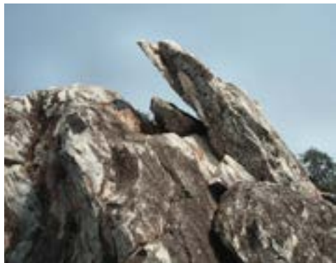
Đỉnh Linh Thứu

Chính từ đỉnh Linh Thứu đức Phật tuyên bố: “ Ta có chánh pháp nhãn tạng, Niết-bàn diệu tâm, thực tướng vô tướng nay truyền trao Ca-diếp ”,