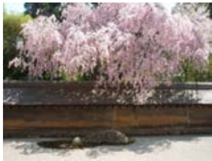
Thạch viên chùa Long An

Một đời tu bây giờ chơ vơ ngôi mộ im lìm trong khuôn viên toàn là mộ với mộ. Thân xác quốc sư bây giờ im lìm tan hoại, nhưng dòng thiền vẫn sinh động tuôn chảy khắp năm châu bốn biển, như lời Hư Đường Trí Ngu đã tiên báo: “ Con cháu biển Đông ngày thêm đả ”. Để không phụ lòng chư tiên đức, ngày nay biển Đông đã nở rộng đến trời Tây xuyên Thái Bình Dương và Đại Tây Dương. Có thể buổi diện kiến hôm nay đã mạnh nha trong lòng tôi suy nghĩ về