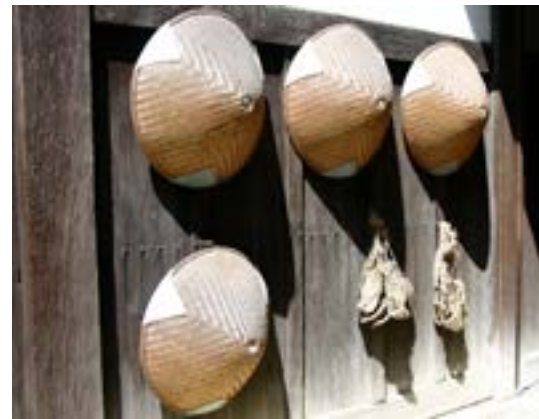
Nón lá, giày cỏ của thiền sư hành khước (chùa Diệu Tâm)