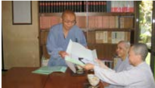
Thầy trụ trì chùa Tùng Âm trao tặng tác giả bức thư pháp

- Điều thiết yếu là làm thế nào mình với núi Phú Sĩ là một.