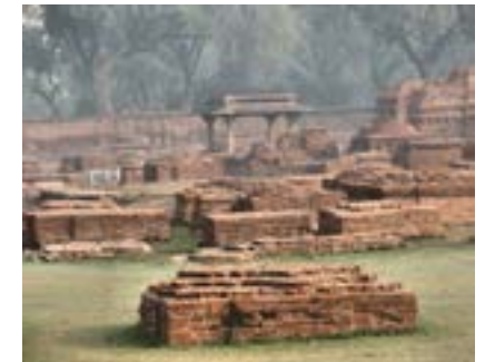
Vườn Lộc Uyển

Về xứ Phật mọi người như mở cờ trong lòng. Đặt chân lên những chỗ những nơi, những con đường Phật và chúng tỳ kheo đã ở và đã