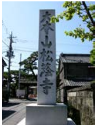
Tên chùa: Đại Bản Sơn Tùng Âm Tự

Trên tàu hỏa bóng dáng núi Phú Sĩ chạy theo chúng tôi một đoạn đường rồi mất hút, sao lại bảo chỗ nào cũng thấy núi Phú Sĩ? Vậy có đến hai Phú Sĩ hay sao? Phú Sĩ nào thấy đó rồi mất đó và Phú Sĩ nào mọi lúc và mọi nơi đều thấy?