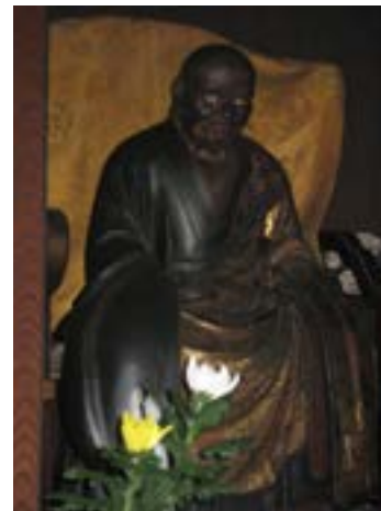
Tượng Bạch Ẩn thờ trong nhà tổ

Đây là buổi đầu đạo nghiệp của Bạch Ẩn, và đây cũng là chiếc nôi giáo dưỡng môn đồ suốt năm mươi năm cho tới ngày viên tịch.