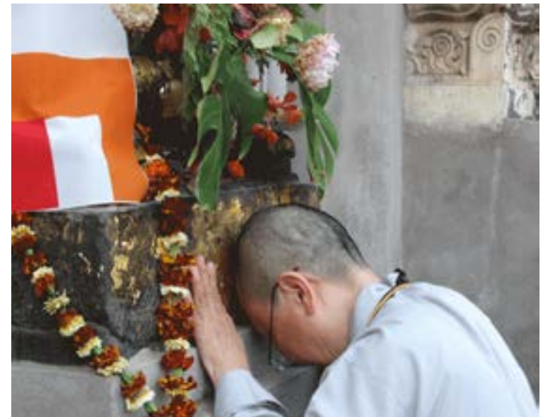
Bồ-đề Đạo Tràng

có thời gian. Sáng trưa chiều tối chỉ từng nớ việc: đi nhiều tháp, lạy Phật, tụng kinh, ngồi thiền, nghe Pháp. Chỗ chật người đông mà bao nhiêu việc diễn ra một lúc vẫn thành tựu tốt đẹp, không lấn cấn, không đụng chạm. Có chăng là vài tà áo chạm nhau sột soạt trên lối đi nhỏ hẹp, thậm chí có lúc người người đụng nhau, nhưng chẳng ai buồn để ý những “tiểu tiết” này. Mọi người, hoặc dân địa phương hoặc từ mọi ngõ ngách xa xôi đến, đang dốc hết thân tâm tập trung vào việc trọng đại nhất đời người: tạo cho mình một vốn liếng tâm linh.