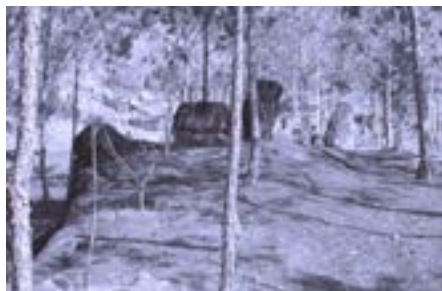
Vườn đá Hương Vân

Tôi đứng đó, nhìn thông rồi nhìn trời, đôi mắt thỏa thuê không gì vướng bận, tâm hồn thư thả không gì suy tư. Và, ô kìa! Những tảng đá đen một màu đen tuyền, lốm đốm những mảng rêu xanh hoặc loang lổ từng vệt trắng trắng. Vị trí và dáng đứng của chúng thật hài hòa với hàng hàng lớp lớp thông xanh. Có những viên đá độc trụ, có những cụm đá hai, ba hoặc bốn viên tựa vào nhau hoặc kê cạnh nhau. Chúng ở đó tự bao giờ không ai biết. Chúng không toát ra một điều gì, không biểu trưng một thứ gì. Chúng đứng đây im lìm và người nhìn chúng cũng đứng đây lặng thinh.