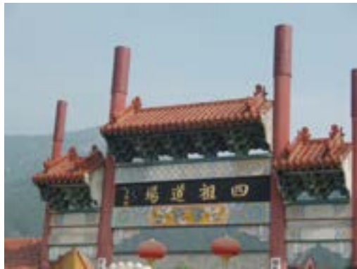
Chùa Tứ Tổ Đạo Tín

Thiền sư Đạo Tín (580-651) họ Mã, người Hà Nội 河内 (nay là huyện Bà Dương 沁陽, Hà Nam 河南), sau đến Kì Châu 蕪州 Quảng Tế 廣濟 (nay là thành phố Vũ Huyệt 武穴, Hồ Bắc 湖北), trấn Mai Xuyên 梅川. 12 tuổi đến núi Tư Không 司空 nơi thiền sư Tăng Xán cầu pháp môn giải thoát, ngay lời đại ngộ. 21 tuổi thọ giới tu học nơi Cát An, Giang Tây. Hơn ba năm, nghe tin Đại sư Tăng Xán đang ở miền Giang Tả cáo thoái tịch, liền về núi Tư Không để hầu Tổ, và được truyền y bát làm Tứ Tổ.