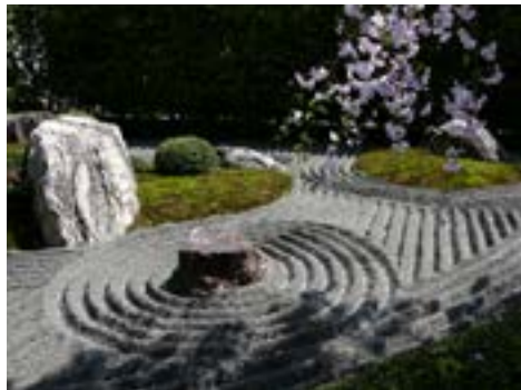
Vườn cảnh chùa Diệu Tâm

Từ Yokohama đi shinkansen (tàu hỏa cao tốc) đến Kyoto, gửi hành lý trong hộp tủ nhà ga xong là chúng tôi, hai Phật tử và hai sư cô, đi ngay đến các chùa.