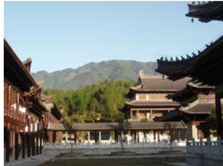
Chùa Bá Trượng

Thuyền của Sơ Tổ Đạt-ma từ Tây Thiên đến Đông độ trước đây mười mấy thế kỷ đã cập bến trên bờ Châu Giang, Quảng Châu. Ngày đầu trên đất Tổ, từ Việt Nam, Úc, Mỹ, Pháp, Canada chúng tôi cũng đến tụ tập nơi đây, bắt đầu chuyến đi về nguồn cội. Nhìn dòng sông với thuyền hoa lễ hội đang diễu hành, cũng