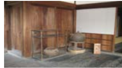
Vật dụng của Quốc Sư Đại Đẳng

Chân tôi bước đi mà vắng vắng đầu đây trong lá trong nắng: “ Sẽ lấy dưa không bằng tay nếu dưa dưa không bằng tay. ” Tay và dưa, phương tiện và cứu cánh,