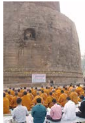
Vườn Lộc Uyển

đi, ngay từ đầu tôi nhận thấy ngay mình đang dần thân vào một cuộc hành trình tuy mới mẻ nhưng không xa lạ. Mới vì tuy cũng đất đai sông núi, cây cỏ ruộng đồng với con người và sinh vật, như tất cả mọi nơi trên trái đất, và lại mang nhiều sắc thái rất gần với Việt Nam, nhưng